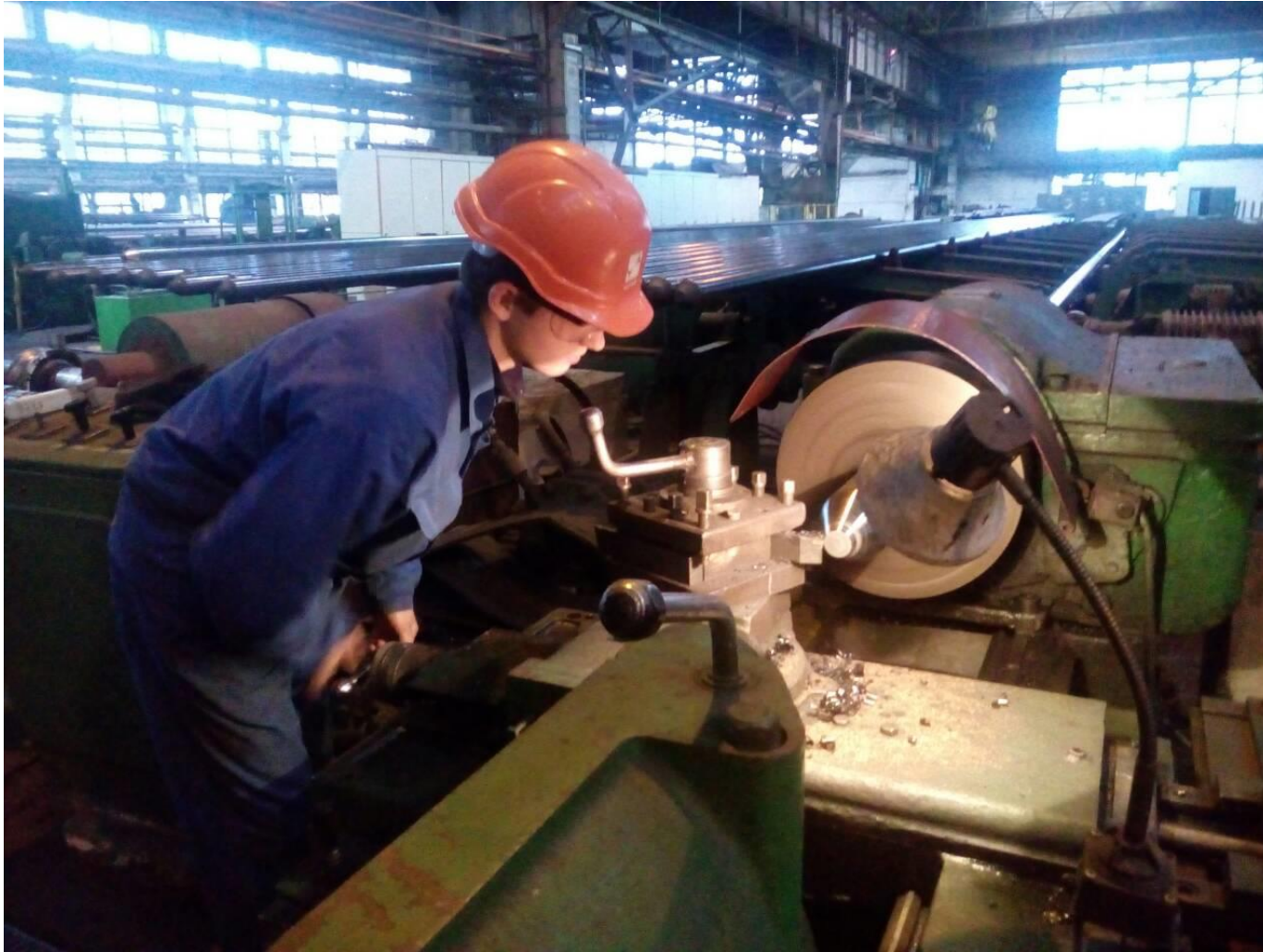
Виробниче навчання на ПрАТ «Нікопольський ремонтний завод» за дуальною формою навчання