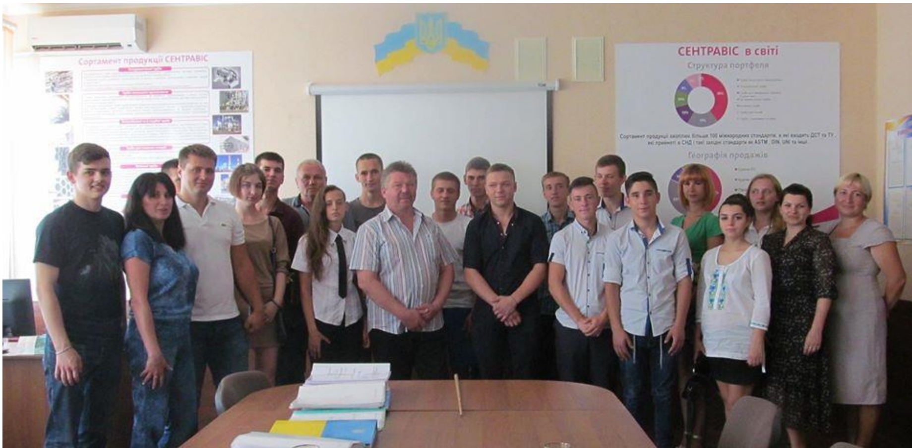
Державна кваліфікаційна атестація учнів групи Т 18 1/11 за участю представників підприємств-замовників