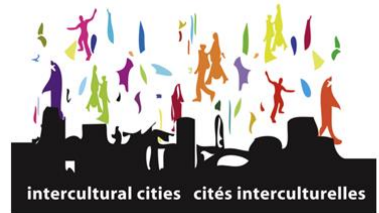
Логотип програми «Інтеркультурні міста»