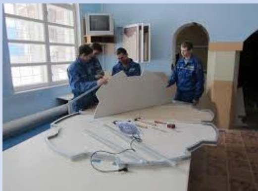
Монтажник гіпсокартонних конструкцій