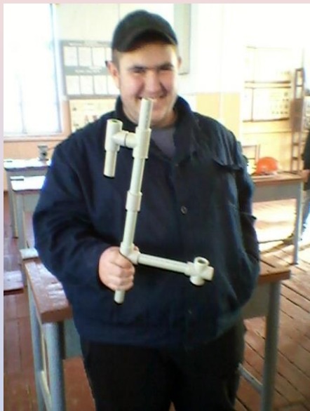
Монтажник сан-тех. систем і устаткування