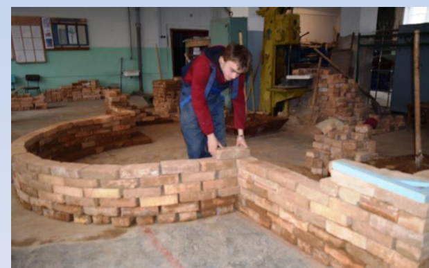
Муляр, монтажник з монтажу сталевих та залізобетонних конструкцій