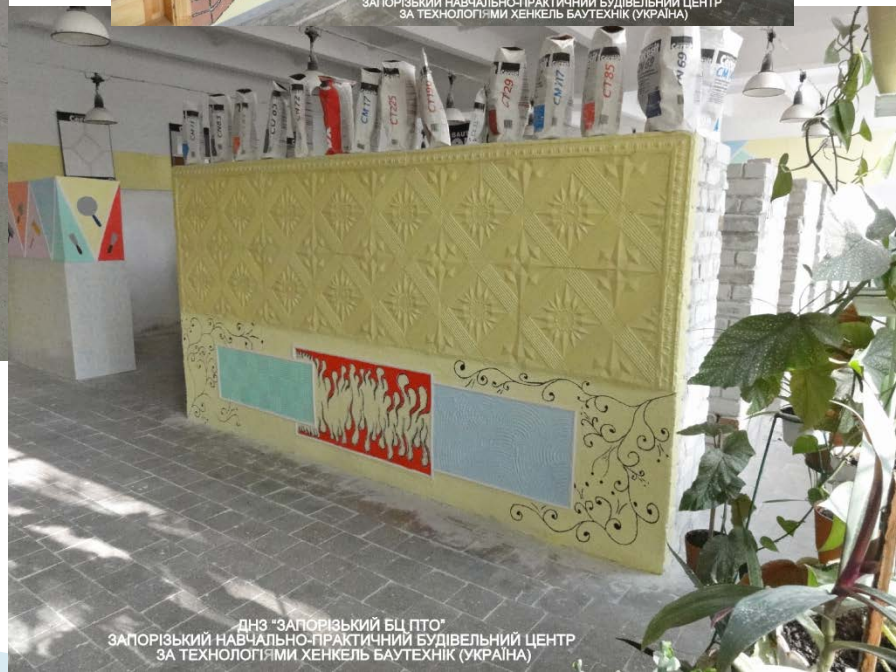
ДНЗ "ЗАПОРІЗЬКИЙ БЦ ПТО" ЗАПОРІЗЬКИЙ НАВЧАЛЬНО-ПРАКТИЧНИЙ БУДІВЕЛЬНИЙ ЦЕНТР ЗА ТЕХНОЛОГІЯМИ ХЕНКЕЛЬ БАУТЕХНІК (УКРАЇНА)