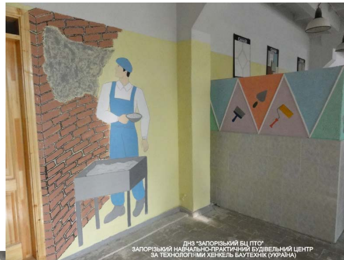
ДНЗ "ЗАПОРІЗЬКИЙ БЦ ПТО" ЗАПОРІЗЬКИЙ НАВЧАЛЬНО-ПРАКТИЧНИЙ БУДІВЕЛЬНИЙ ЦЕНТР ЗА ТЕХНОЛОГІЯМИ ХЕНКЕЛЬ БАУТЕХНІК (УКРАЇНА)