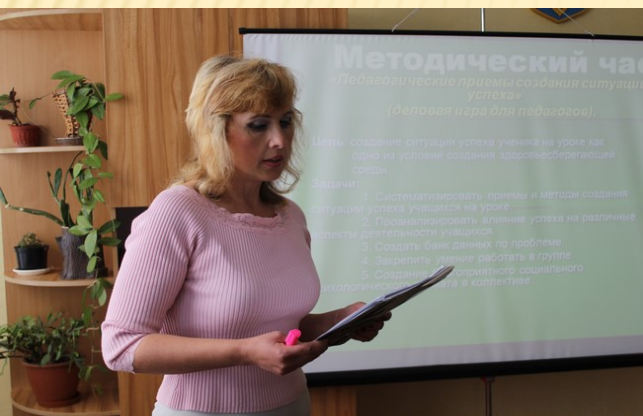
Ділова гра «Педагогічний аналіз уроку»