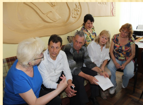
«Методичні посиденьки» Засідання МК природничо-математичної підготовки