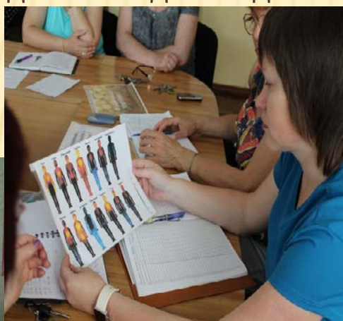
Консультація «Валеологічні принципи підтримки здоров'я педагога »