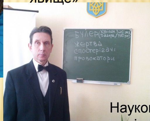
Науково-практичний семінар «Профілактика професійного вигорання»