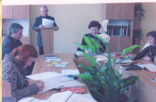
ІМН «КМЗ як оптимальна система навчально-методичної документації, засобів навчання»